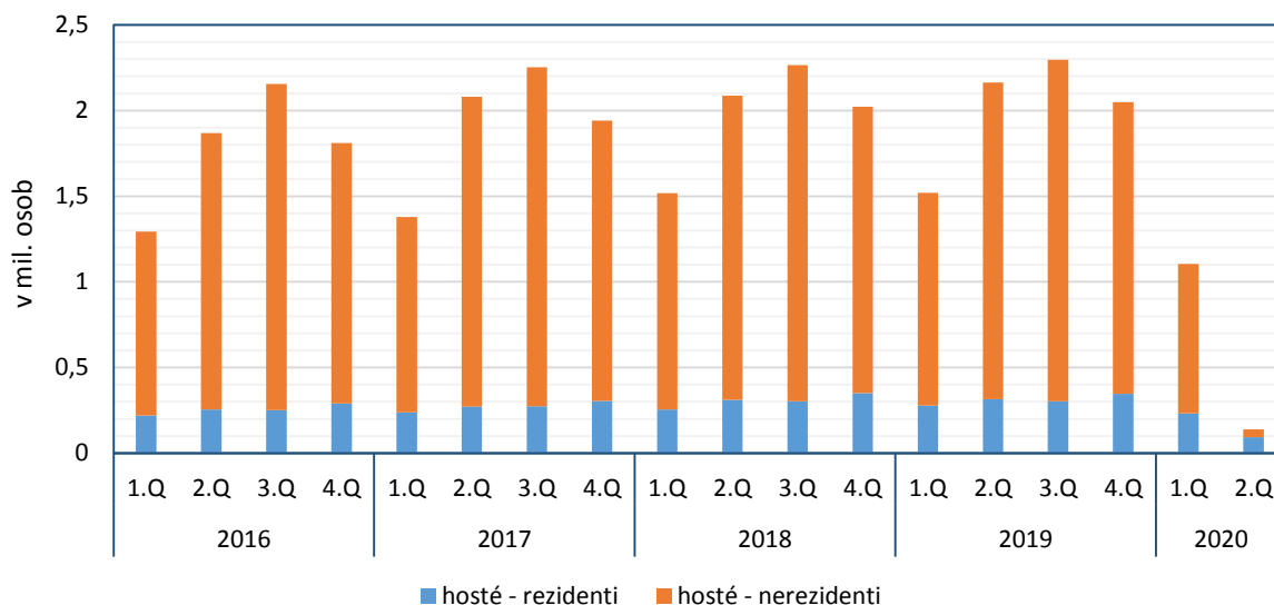
Obrázek 1: Počet návštěvníků hromadných ubytovacích zařízení v hl. m. Praze podle čtvrtletí v letech 2016–2020

Hl. m. Praha je dlouhodobě nejnavštěvovanějším krajem v Česku. V důsledku epidemiologických opatření však Praha ve 2. čtvrtletí roku 2020 neměla v mezikrajském srovnání tak významné postavení. V pražských ubytovacích zařízeních se ve 2. čtvrtletí 2020 ubytovalo 14 % všech registrovaných návštěvníků Česka a 35,9 % všech zahraničních hostů (nerezidentů).