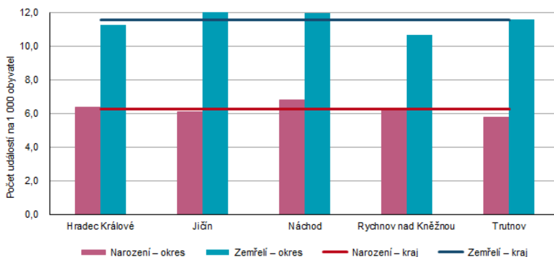
Graf 1 Živě narození a zemřelí v Královéhradeckém kraji podle okresů v 1. čtvrtletí 2026

Celkově v kraji ubylo 1 438 obyvatel , v přepočtu na 1 000 obyvatel středního stavu to bylo 10,5 ‰. V žádném z pěti okresů kraje nebyl v 1. čtvrtletí zaznamenán celkový přírůstek obyvatel. Absolutně nejvíce obyvatel ubylo v okrese Hradec Králové (-434 osob), relativně v okrese Rychnov nad Kněžnou (-12,1 ‰).