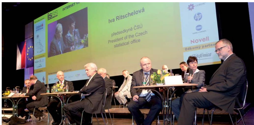
Předsedkyně ČSÚ Iva Ritschelová na slavnostním zahájení konference informovala o vytvoření pracovní skupiny pro Sčítání lidu, domu a bytů v roce 2021, které využije i data ze základních registrů.

Jednotlivé orgány veřejné moci již nebudou oprávněny podle zá-