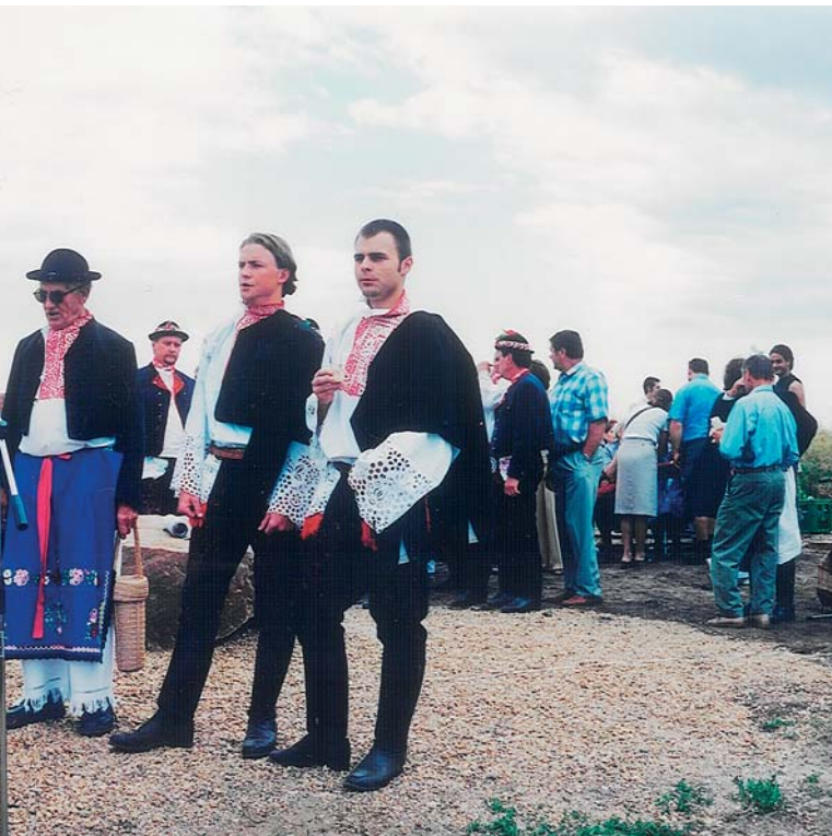
Členové mužského sboru z Ratíškovic dokáží vzít za srdce. Vrch Náklo se pod jejich zvučnými hlasy v roce 2006 doslova otřásal. A to si přitom všechno (kroj a aparaturu) platí ze svého.

prostředků na investice, zaostávají ním ve vývoji mezd apod. Proto situaci v kultuře často vidíme tak, že z pohledu vynakládání veřejných prostředků je tato oblast neprávem opomíjena a není doceněna její nezastupitelná úloha v kultivaci jedince i společnosti.