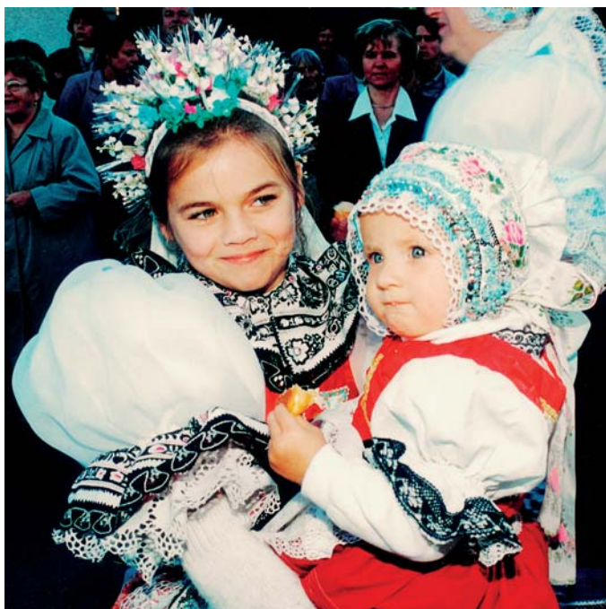
Lásku k tradicím pěstují v Dubňanech na Hodonínsku již od útlého věku.

Vrátíme se však k rozdílným ekonomickým podmínkám kulturních oborů. Asi nejvíce vypovídající bude porovnání produktivity práce na jednoho zaměstnance