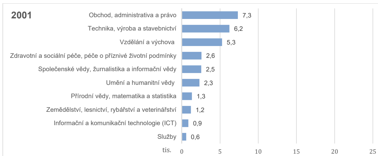
Graf č. 11 Absolventi VŠ v ČR - počet absolventů dle skupin oborů vzdělání

Podíváme-li se na počty absolventů dle jednotlivých skupin oborů, pak v roce 2001, 2010 i 2020 absolvoval nejvyšší počet studentů obory ze skupiny Obchod, administrativa a právo . Tato skupina oborů zároveň vykázala v průběhu času poměrně dynamický průběh, kdy se mezi roky 2002 a 2012 počet absolventů více než ztrojnásobil (vzrostl ze 7 053 na 23 627) a poté do roku 2020 postupně klesal až na 12 748 absolventů. Podobnou, přestože méně výraznou, tendenci zaznamenala i skupina oborů Technika, výroba a stavebnictví . Počet absolventů této skupiny oborů vzrostl z 6 228 absolventů v roce 2001 až na 14 666 absolventů v roce 2011. Poté jejich počet klesal až na 10 378 v roce 2020. Na třetí příčce v počtu absolventů se v čase většinou udržuje skupina oborů Vzdělávání a výchova s 5 222 absolventy v roce 2002, 12 902 absolventy v roce 2011 a 7 226 absolventů v roce 2020. V letech 2015 až 2019 však zaznamenala vyšší počet absolventů již skupina oborů Společenské vědy, žurnalistika a informační vědy a v roce 2020 absolvovalo obory ze skupiny Vzdělávání a výchova jen o 165 studentů více než obory ze skupiny Společenské vědy, žurnalistika a informační vědy. Naopak, jak je patrné z grafu č. 11, o poznání méně absolventů než ostatní obory zaznamenaly skupiny oborů Přírodní vědy, matematika a statistika, Informační a komunikační technologie, Služby a Zemědělství, lesnictví, rybářství a veterinářství . Pořadí těchto skupin oborů v příčce dle četnosti absolventů se však v čase proměňovalo.