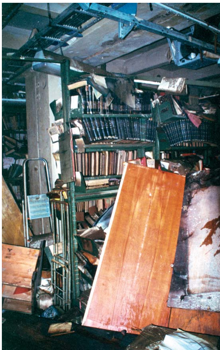
Skutečnost předčila ty nejhrušnější představy.

Když knihovnice vstoupily do dveří svého bývalého pracoviště, nevěřily vlastním očím. Přivítaly je rozmáčené knihy, vyvrácené regály, zničený lístkový katalog. Všude