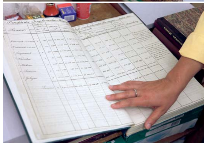
Člověk by nevěřil, že staré tisky ležely v bahně Karlína.