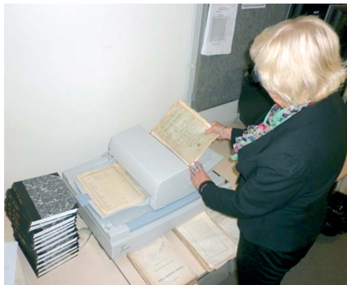
Do konce roku 2010 se naskenovalo 262 publikací.

Provoz knihovny pro veřejnost byl obnoven v květnu 2004 poté, co se ČSÚ přestěhoval do nové budovy. Fond knihovny musel být