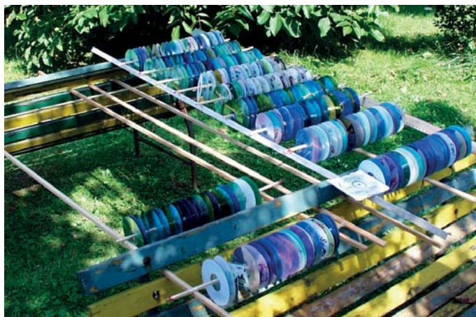
Provizorní CD sušička splnila svůj účel.

Zpočátku nám pohled na budovu našeho úřadu nepřipadal tak strašný. Okna byla asi třicet čísel nad hladinou. Jenže pak jsme s hrůzou zjistili, že ta okna patří prvnímu patru, nikoliv přízemí, jak jsme si původně mysleli. Aby také ne. Z oficiálních zdrojů jsme se později dozvěděli, že v Karlíně v té době stála voda hluboká čtyři a půl metru. Když opadla, vydali jsme se do úřadu. Naskytnul se nám příšerný pohled. Před námi ležela změt ledniček, počítačů, knih a nábytku, vše bohatě prolité řídkým kluzkým páchnoucím bahýnkem. Na tu neopakovatelnou „vůni“ pražské povodně do smrti nikdo z nás nezapomene.