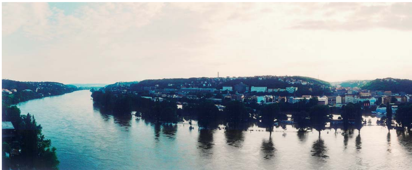
Moře vody, kam jen oko dohlédne – Praha, 13. srpna 2002.

Od ničivých povodní v roce 2002 uplynulo již devět let. Přesto se v Českém statistickém úřadu berou denně do ruky relikvie, které je připomínají. Řeč je o zachráněných knihách , tzv. „utopencích“.