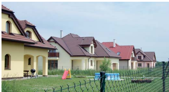
Květnice je typickým příkladem procesu suburbanizace.

Na krajské pracoviště ČSÚ se s požadavkem na zpracování statistických dat obrací často právě obce, které o dopadech procesu suburbanizace ví své. Používají je jako podklad pro řešení svých rozvojových potřeb, případně získání dotací. Přitom právě v rychle se rozvíjejících lokalitách není někdy pro pracovníky ČSÚ vůbec jednoduché údaje zjistit. To, že mnoho lidí sice nově bydlí ve Středočeském kraji, ale nadále pracuje v hlavním městě, se tak