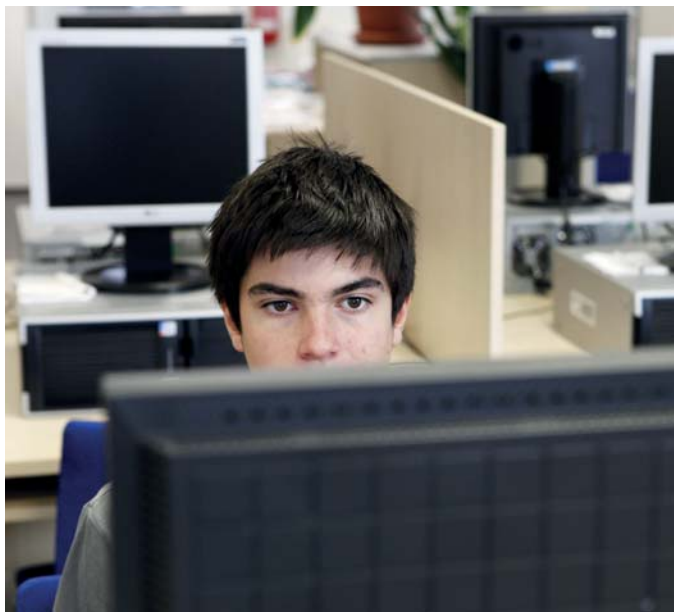
Uživatelé dat nejraději komunikují s ČSÚ přes e-mail .

Zajímavý je i pohled na způsob přijímání a vyřizování požadavků uživatelů. V krajích je většina požadavků přijímána prostřednictvím telefonu a vyřizována e-mailem nebo telefonem (někdy i osobním jednáním). Záleží vždy na rozsahu po-