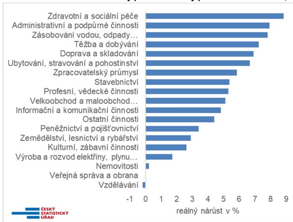
Graf 2: Reálné meziroční nárůsty průměrné mzdy podle sekce CZ-NACE, %

Mzdová dynamika byla v 1. čtvrtletí 2024 opět velmi různorodá podle odvětví. Sice byl všude nominálně kladný meziroční nárůst, avšak u dvou sekcí CZ-NACE jde o hodnotu nepřesahující nárůst spotřebitelských cen (o 2,1 %), takže v reálném vyjádření mzdy těmito zaměstnancům nevzrostly. Konkrétně jde o odvětví vzdělávání a veřejnou správu, kde jsou platy zaměstnanců řízeny centrálně podle tzv. platových tabulek. Ty se podle rozhodnutí Vlády pro letošní rok nezvyšovaly. Ve vzdělávání tak došlo k nominálnímu růstu pouze o 1,9 % a ve veřejné správě o 2,1 %.