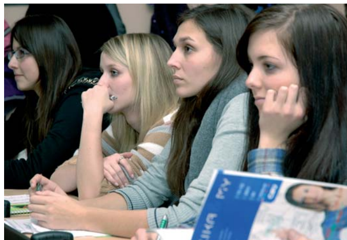
Časopis ČSÚ Statistika & My studentky zaujal.