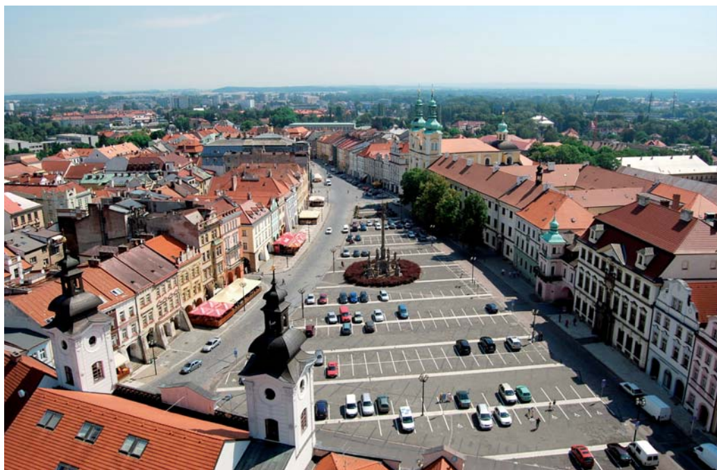
V Hradci Králové ČSÚ spolupracuje s místními institucemi zejména v oblasti vzdělávání a předávání regionálních dat.

Vzájemná spolupráce mezi Univerzitou Hradec Králové a Českým statistickým úřadem se neustále rozvíjí. Přináší mnoho nových inspirací, námětů a dalších možností pro poskytování statistických údajů široké veřejnosti. I v období masivního využívání komunikační a informační techniky a technologií je třeba více informací o tom, co poskytuje státní statistická služba. Všichni zájemci o statistická data, kteří potřebují další upřesnění či pomoc při hledání údajů na internetových stránkách ČSÚ, mohou kontaktovat oddělení informačních služeb. Informace lze získat