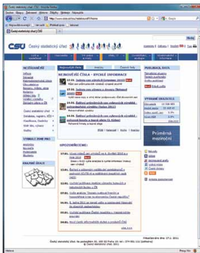
Aktuální podoba úvodní stránky Českého statistického úřadu.

Novou podobu dostal Ceník informačních služeb a produktů . Obsahuje jak úplný seznam nabízených služeb, databází a výběrů z nich, tak i ceník všech nabízených publikací.