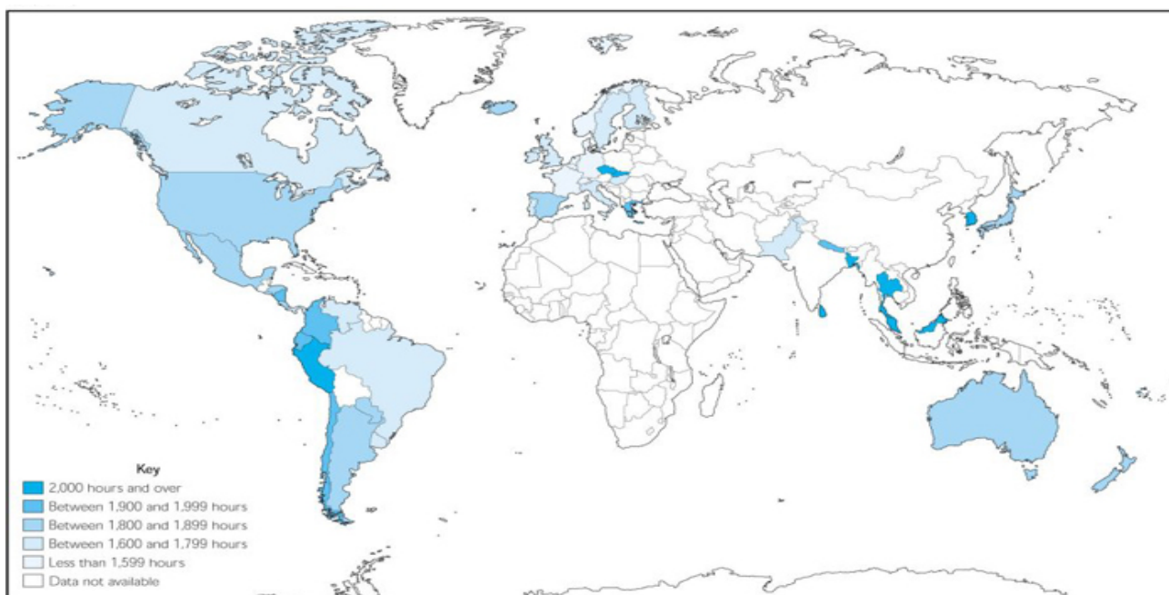
Graf č. 4 Srovnání počtu odpracovaných hodin na osobu za rok (poslední léta)

Podle propočtů institutu Ifo v roce 1997 průměrný migrant, který žil v Německu méně než deset let, obdržel od státu ročně zhruba 2400 eur. Nejedná se přitom pouze o zaměstnané migranty, ale také o jejich rodinné příslušníky a vůbec každého, kdo přišel ze zahraničí a žil v této době v Německu. V úhrnu za deset let tedy pětičlenná rodina obdržela zhruba 120 tisíc eur, což je evidentně enormní částka. Dlouhodobý pobyt přitom znamená, že „dárky“ od státu, jak nazývá bez uvozovek tyto dávky institut Ifo, jsou nižší, protože mzdy migrantů rostou. Čistým přispěvatelem do systému sociálního státu (rozpočtu vlády) se stává ten, kdo zůstane po emigraci v Německu déle než 25 let. Podle výsledků studie Ifo se však jedná pouze o malou část celkového počtu migrantů (buď zemřou nebo do uvedené doby opustí zemi).