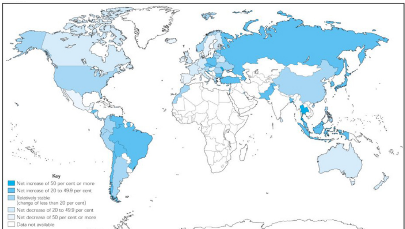
Graf č. 2 Procentní změna v celkové míře nezaměstnanosti (posledních pět let, od roku 1994)