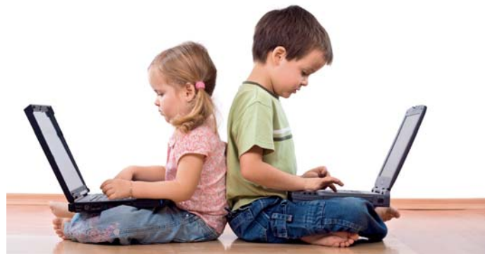
Děti patří k významným uživatelům osobních počítačů.

Téměř všechny děti, které mají doma počítač, ho také používají. Přičemž 86 % všech dětí (96 % těch, co mají doma počítač) se řadí k pravidelným uživatelům počítače (používají jej minimálně jed-