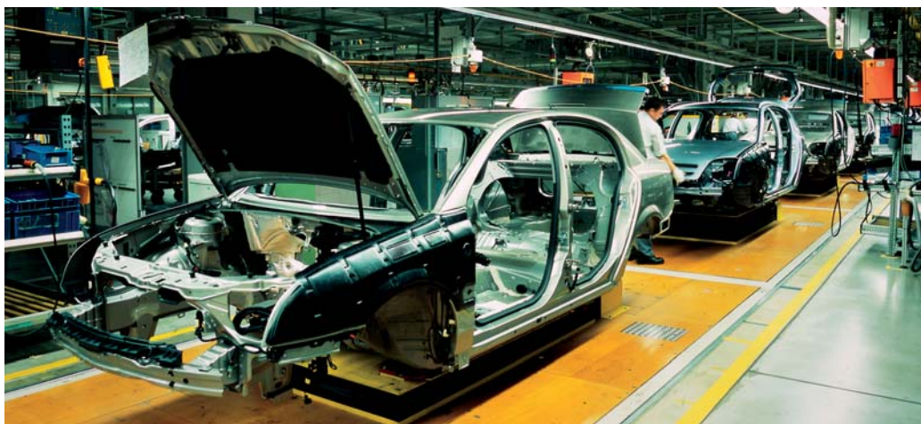
Kompletní motorová vozidla tvoří 51,2 % výrobků v odvětví, 48 % připadá na díly a příslušenství.

Statistika PRODCOM představuje obrovské množství detailních informací o výrobě úzce definovaných výrobků. Pokud ale sečteme hodnotu jejich produkce, například na úroveň oddílů klasifikace produkce CZ-CPA, dostaneme zpracovatelský průmysl v kostce. Takové cvičení je spíše informativní, protože při něm dochází k vícenásobnému započtení řady výrobků, sčítání meziproductů s konečnými produkty a podobně. I tak ale dává zajímavé výsledky.