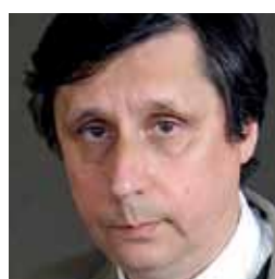
Jan Fischer Ing., CSc. | ČSÚ 2003–2010