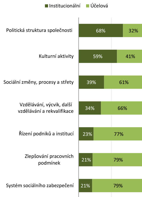
GRAF 2.8-3: Společenské struktury a vztahy (SEO 08) – struktura podle typu státní podpory; 2011