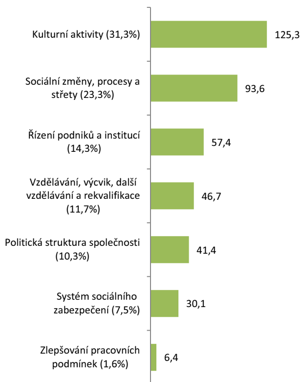
GRAF 2.8-2: Společenské struktury a vztahy (SEO 08) – jednotlivé cíle podle NABS 1992 (% a částky v mil. Kč); 2011