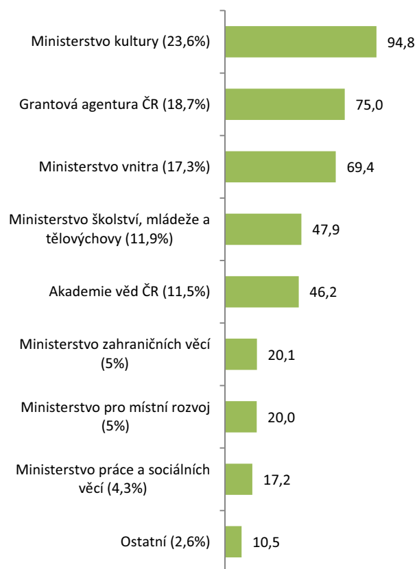
GRAF 2.8-4: Společenské struktury a vztahy (SEO 08) – příspěvky poskytovatelů (% a částky v mil. Kč); 2011