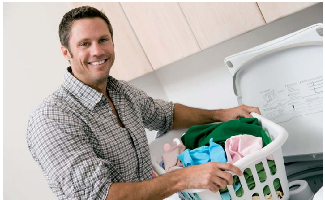
Nejdelší zdravou délkou života se mohou pochlubit Švédové .

Ukazatel zdravá délka života (někdy je také nazýván jako „období života ve zdraví“) je strukturálním ukazatelem a je již několik