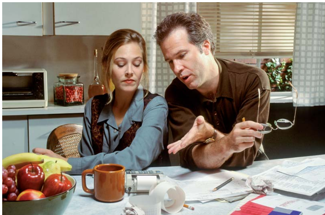
Průměrný čistý peněžní příjem na osobu a rok se mezi lety 2005 a 2011 zvýšil z necelých 104 tis. Kč na 144,6 tis. Kč.

Tento evropský ukazatel tvoří celkem devět proměnných. Zjišťuje se, zda domácnost vlastní barevnou televizi, telefon, pračku či auto. Dále se sleduje, jestli si může domácnost dovolit týdenní dovolenou mimo domov pro všechny členy domácnosti, dostatečně vytápět byt, jíst maso či jeho vegetariánské náhražky každý druhý den nebo zaplatit neočekávaný výdaj v konkrétní výši. V centru zájmu stojí také to, zda má domácnost potíže se zaplacením nájmu, různých plateb a splátek půjček na bydlení či