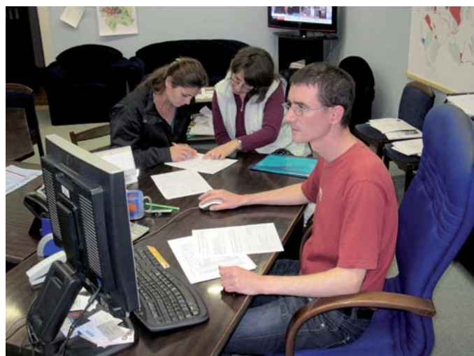
Okrsková komise si mohla převzaté údaje na místě zkontrolovat.

Rušno bylo při volbách nejen v regionech, kde se přebíraly výsledky hlasování od okrskových volebních komisí, ale i v ústředí ČSÚ,