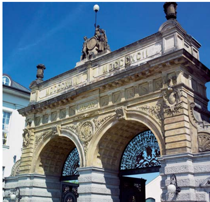
Plzeňský kraj je spojen s výrobou národního nápoje, plzeňského piva.