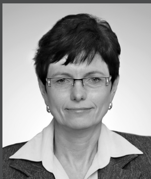
ČSÚ od 2010