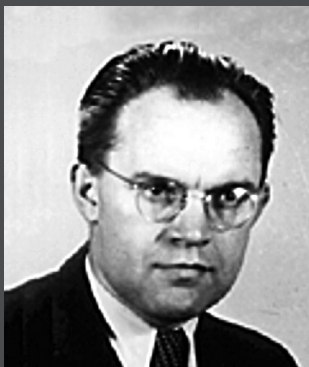
ÚÚSKS 1961–1963, ÚKLKS 1963–1966