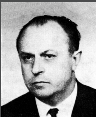
SSÚ, později FSÚ 1967–1981

troly a statistiky (tedy fakticky předseda Státního statistického úřadu). Tuto funkci pak zastával až do roku 1967 i v následující vládě v Ústřední komisi lidové kontroly a statistiky. Zasedal v předsednictvu Slovenské národní rady. Na konci kariéry působil jako velvyslanec ČSSR v Bulharsku a Řecku.