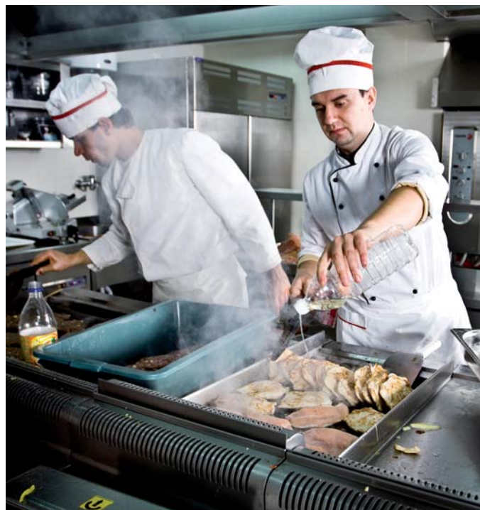
Průměrná hodinová sazba je od 3,5 eur v Bulharsku až po 39,3 eur v Belgii.

Úroveň celkových nákladů práce v průmyslu a službách je v EU neuvěřitelně různorodá – rozdíl mezi průměrnou hodinovou sazbou je od 3,5 eur v Bulharsku až po 39,3 eur v Belgii. V největší – německé – ekonomice je to 30,1 eur. Česká republika je s 10,7 eury daleko za státy západní Evropy. Na druhou stranu má Česko nejvyšší úroveň ze ze-